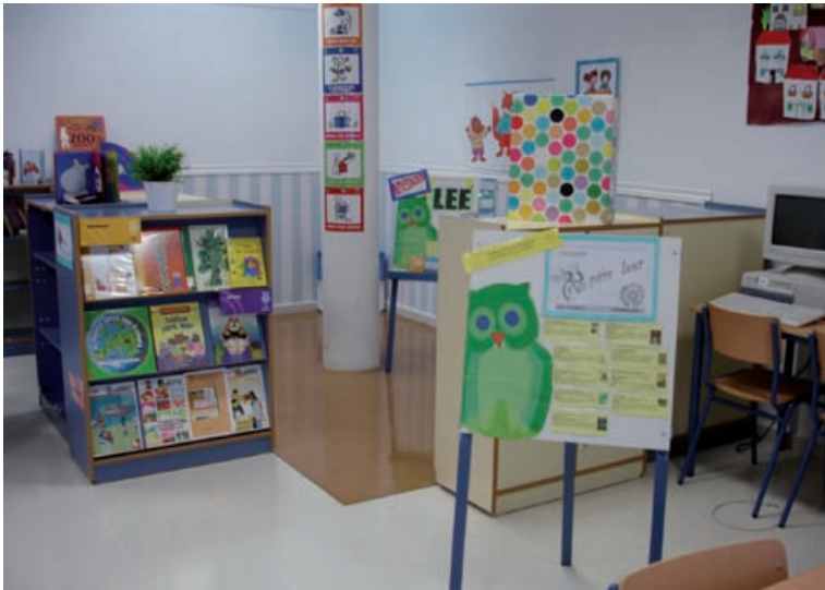
Vista general de la biblioteca.

En la búsqueda de otros estilos docentes distintos al tradicional, nos reencontramos con la metodología por proyectos de trabajo haciendo uso de la biblioteca escolar. Con la implementación del primero, recibimos el reconocimiento por parte de la Delegación Provincial de Málaga, que nos publicó el trabajo realizado, lo que nos animó a seguir con mayor energía y mucha alegría.