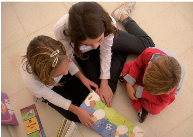
Actividades de lectura con los más pequeños.