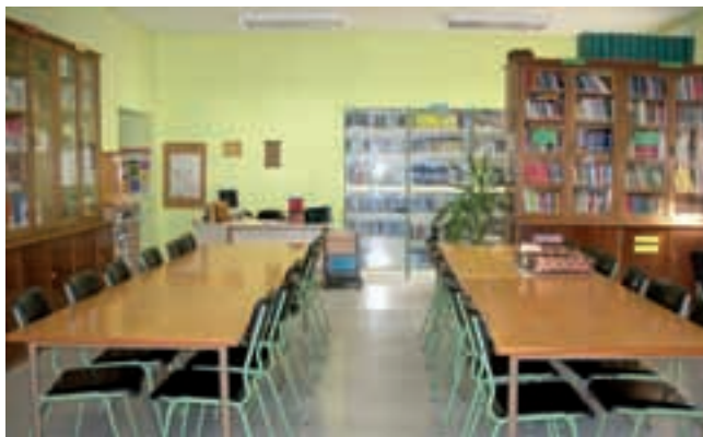
Sala I después de las obras.

el Ayuntamiento no tiene competencias en Educación Secundaria. Las obras se llevaron a cabo en el verano de 2006, adelantando en un curso lo previsto en el Programa de dirección. En los cursos 2006-2007 y 2007-2008, se ha completado la instalación de recursos informáticos, bibliográficos, mobiliario, etc.