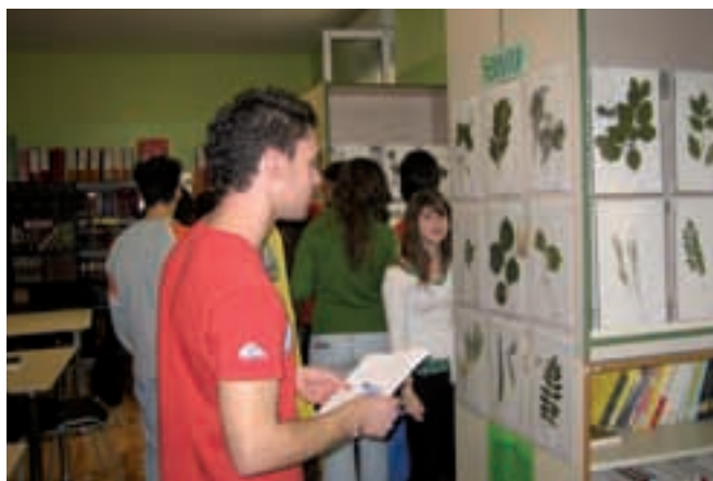
Herbario, en la exposición sobre el Marqués de Santillana y su época.