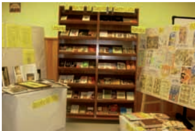
Exposición "El Rincón del Marqués de Santillana".