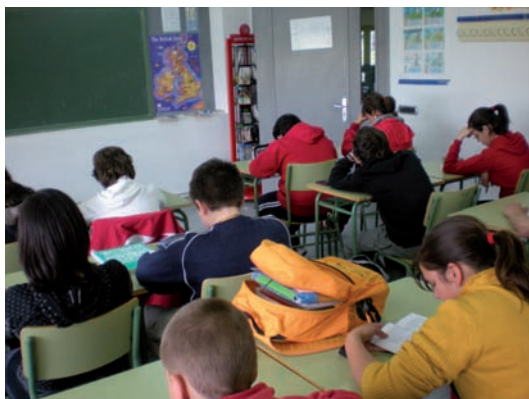
Alumnos en la “Hora de leer”.

Se dotaron las aulas de secciones documentales específicas y se aportaron mochilas viajeras.