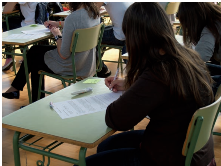
Alumnos participantes en el certamen literario.

Las lecturas, en dicha convocatoria, versaron en torno a la guerra civil española, coincidiendo con la celebración del 70 aniversario del fin del conflicto. Agustín Fernández Paz, Premio Nacional de Literatura, estuvo con los miembros del club. Como colofón, se organizó una salida a la isla de San Simón, testimonio de acontecimientos vividos en este período.