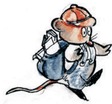
MR. FÓNIX INVESTIGA

Este proyecto se centra en el área de conocimiento del medio, un área que se percibe como atractiva. Dentro del área se eligieron unos bloques de contenido generales atendiendo a criterios de cercanía, actualidad, interés y posibilidad de concreción en cada ciclo y nivel: El cuerpo humano, los animales y Europa. Cada bloque se organizó en una quincena de cada trimestre y desde la biblioteca se dispusieron los horarios de la utilización de los diferentes espacios y recursos. En función de los contenidos concretos y las estrategias de trabajo, el equipo de biblioteca, en coordinación con los tutores, buscó los materiales de trabajo bibliográficos, audiovisuales, páginas web, etc.