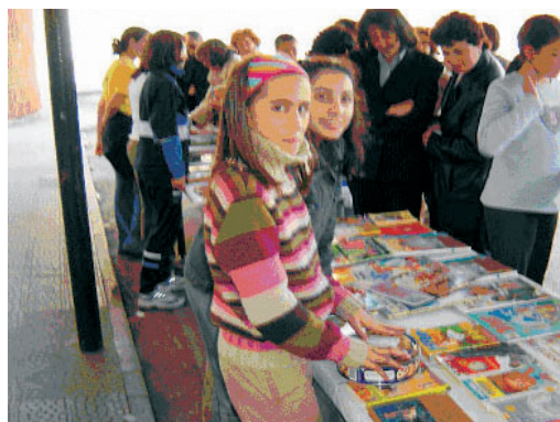
Mercadillo de libros usados

Un grupo de los alumnos bibliotecarios realizó las veces de repor- teros y diariamente se elaboraba una pequeña publicación con las actividades llevadas a cabo, las entrevistas a los protagonistas y sus fotos, que cada alumno se llevaba como recuerdo de la actividad. Los alumnos realizaron, como colofón, una obra de teatro con Mr. Fónix como protagonista.