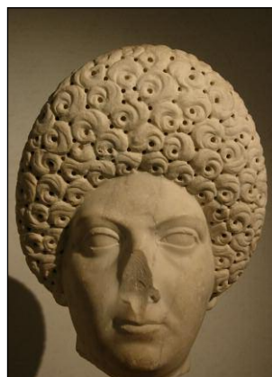
Mujer flavia, Gylptoteca Carlsberg de Copenhague