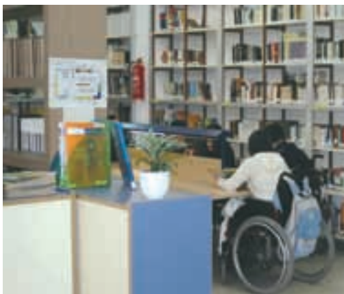
La biblioteca no tiene barreras arquitectónicas.

La biblioteca registra todos los fondos documentales del centro, independientemente de su ubicación (sala central, departamentos y bibliotecas de aula). Disponemos de algo más de 10.000 documentos.