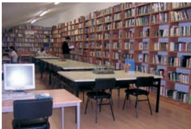
Vista general de la biblioteca.

La biblioteca está en la planta baja y tiene acceso directo desde la galería que da paso a las aulas. Ocupa una extensión de 80 m 2 aproximadamente. Tres ventanales de 260 x 120 cm al exterior facilitan la iluminación natural durante el día. Tiene capacidad para 40 personas y 6 plazas de ordenador. Las plazas se reparten en 5 mesas de 180 x 120 cm, con 8 sillas por mesa. Los ordenadores se encuentran en mesas independientes.