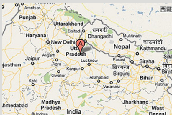
Situación de la población de Nagla Khuru, en el estado de Uttar Pradesh (norte de la India)

Los jóvenes se fugaron para la boda y regresaron al día siguiente a su pueblo, donde los esperaba una multitud.