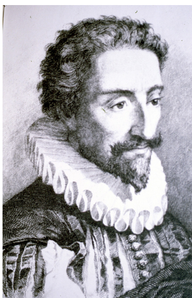
Miguel de Cervantes