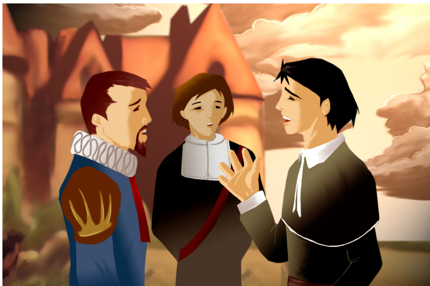
El Licenciado Vidriera hablando con unos comediantes. Ricardo Polo López ( Recursos TIC CC BY-NC-SA 3.0 )