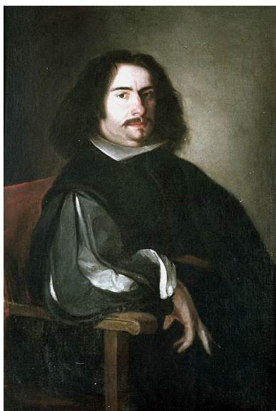
Agustín Moreto por Juan de Pareja (h. 1650). Fundación Lázaro Galdiano