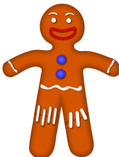
Hombre de jengibre

Una vez más, Cervantes es un precursor, ya que trabaja perfectamente las sensaciones en el comienzo del capítulo XX de la Primera parte del Quijote . Puede servirte como modelo si analizas previamente cómo trabaja la palabra.