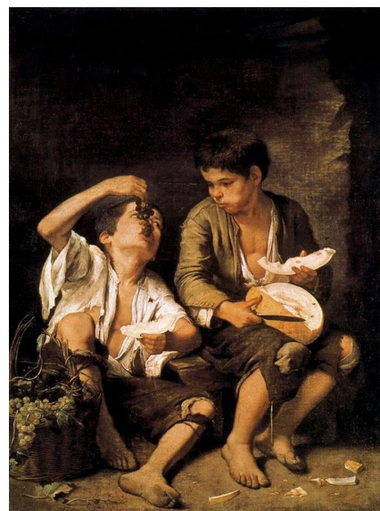
Niños comiendo uvas y melón. Murillo. Alte Pinakothek (Munich)