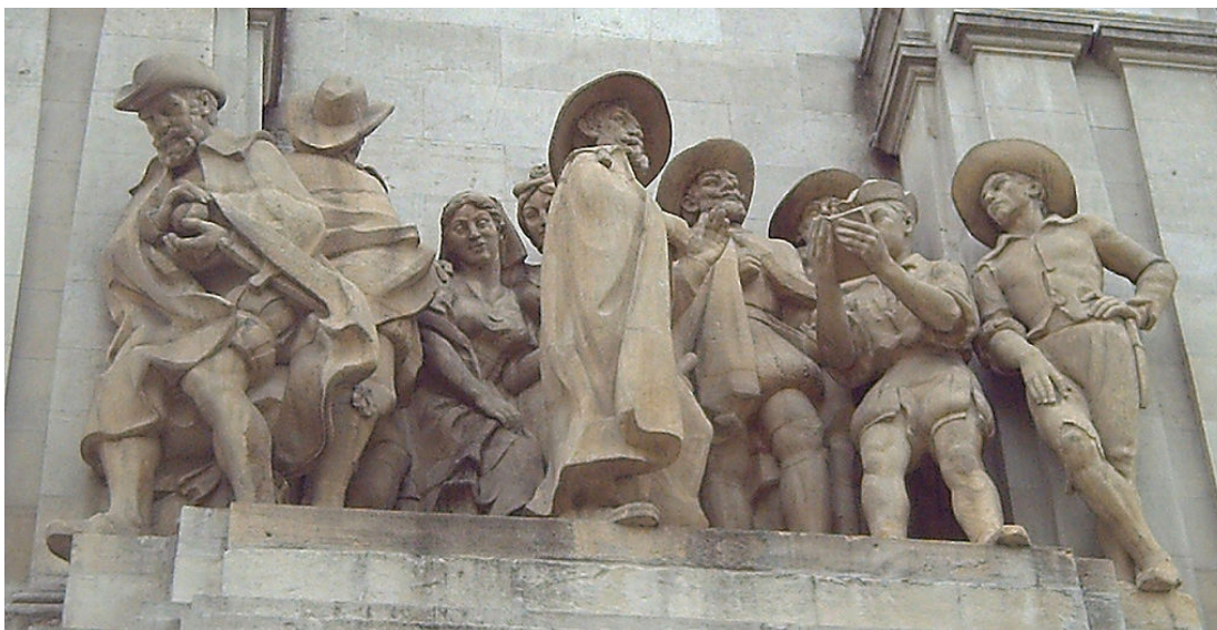
Patio de Monipodio. Detalle de la Plaza de España en Madrid