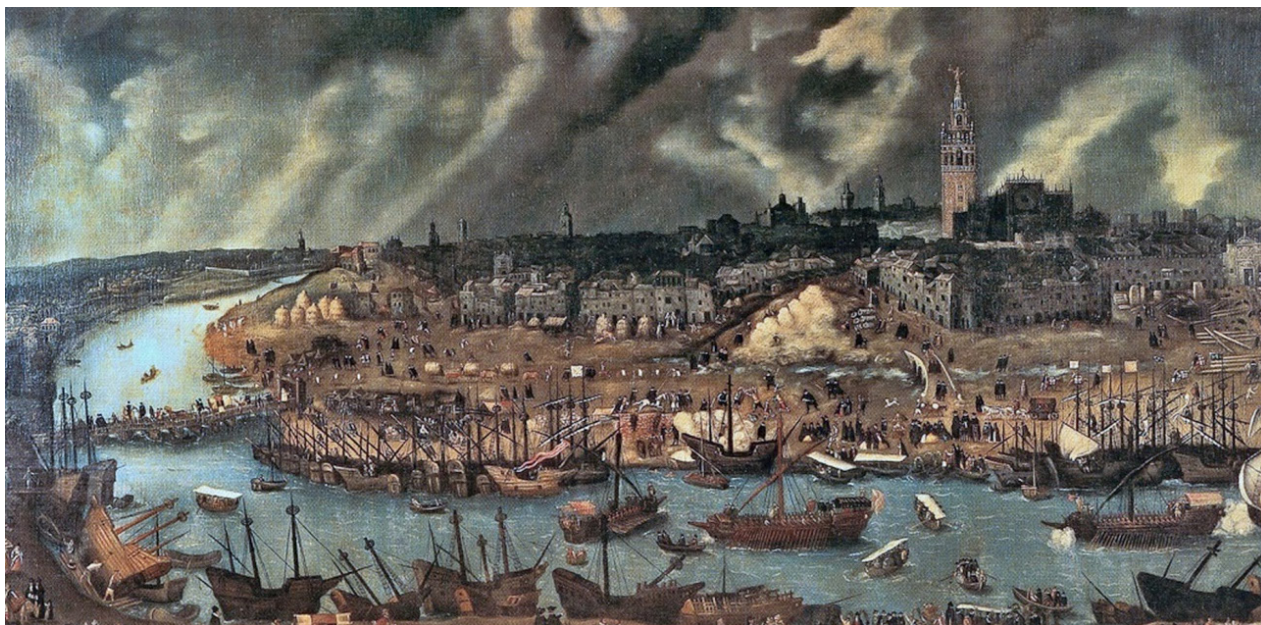
Vista de la ciudad de Sevilla (h. 1570-1600) de Sánchez Coello. Museo de América de Madrid