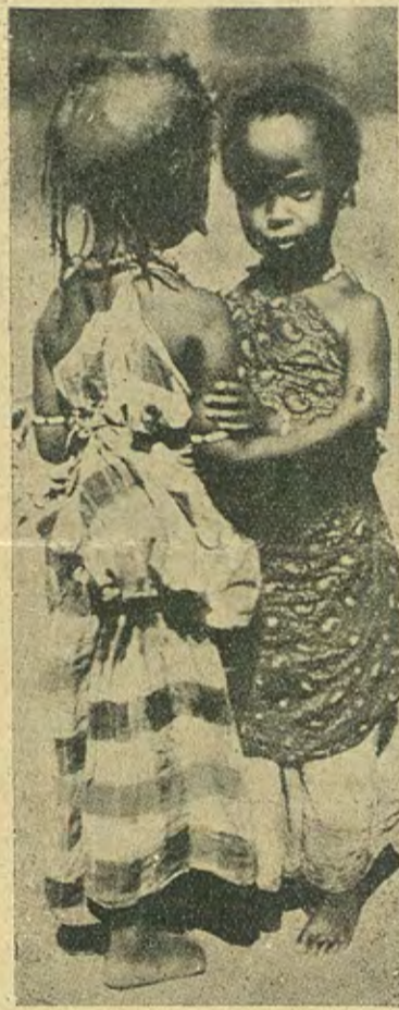
Imagen de aquellas procesiones, de aquellas ceremonias eucarísticas, en que los niños, vestidos de blanco, serietos y perplejos ante ritos para ellos incomprensibles, desempeñaban papel preponderante, son estas... (no encontramos la palabra para clasificarlas, pero a los labios se nos viene la de «comparsas») en que a criaturitas de cinco a doce años se las disfrazaba de enfermeras o de milicianos y bajo canciones, tan incomprensibles para ellas como los cantos y los rezos de antaño,

Los niños del Congo también son niños. Bien lo demuestra la sonrisa de estos pequeños. Niños de España: vuestros compañeros de juego serán los niños de todas partes