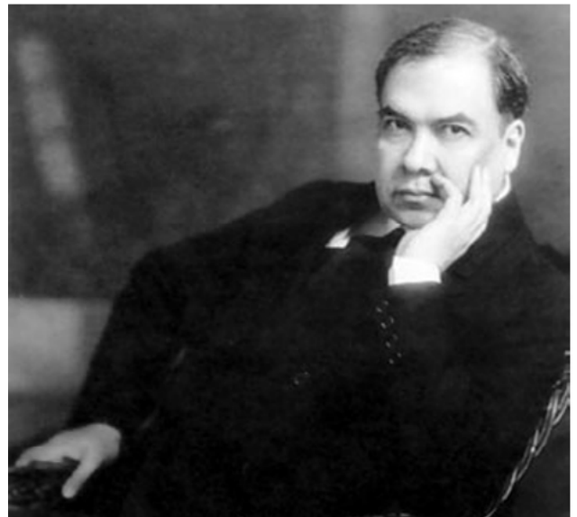
Ilustración 5. Ruben Darío.