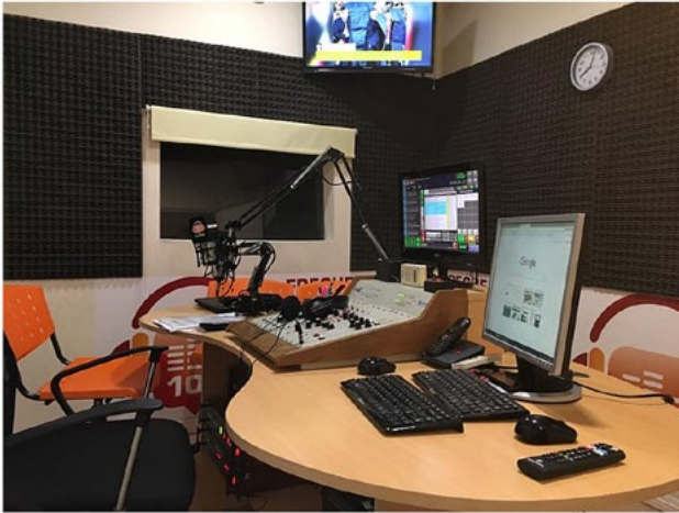
Ilustración 3. Estudio de radio.

Si es necesario, puedes encontrar las claves para la creación de un podcast en clase en este recurso del INTEF .