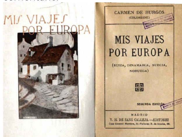
Ilustración 2. Portada de Mis viajes por Europa

caso por la lluvia que cae incesante e impregna la narración de un aura de nostalgia. Además, al llegar a una ciudad desconocida, la narradora recurre frecuentemente a la comparación a través de diferentes figuras y estrategias retóricas. Estos son solo algunos de los aspectos que podrían orientar el comentario.