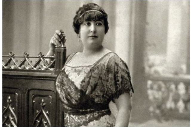
Ilustración 4. Colombine.

literatura, arquitectura, arte, historia, geografía o sociología. Y, en definitiva, ten presente que los géneros literarios no son moldes cerrados y siempre nos permiten ir más lejos.