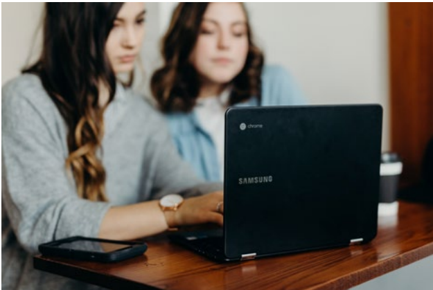
Ilustración 3. Jovénes delante de un ordenador

Descripción de la actividad: Propuesta de exposición a dos voces de un producto propio de la cultura española popular en el que se distingan dos posturas enfrentadas que representen el bien y el mal y sirvan, así, para generar un debate junto al resto de sus compañeros acerca de la distancia o cercanía de ambas posturas y la volubilidad de los conceptos de bueno y/o malo.