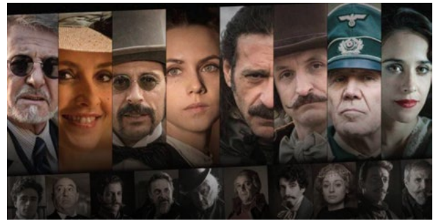
Ilustración 2. Personajes de la serie El Ministerio del Tiempo .